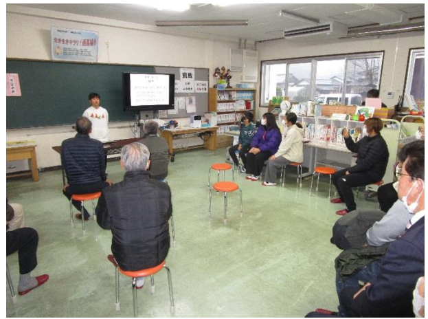
6年生は自分の「将来の夢」を発表しました