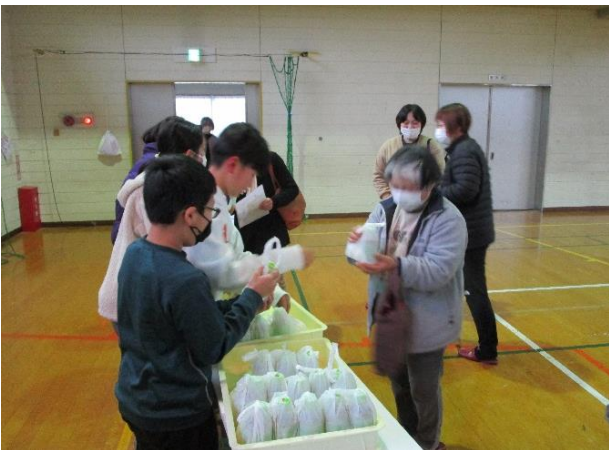
自分たちが作った米で炊いたおにぎりを地域の人にプレゼント