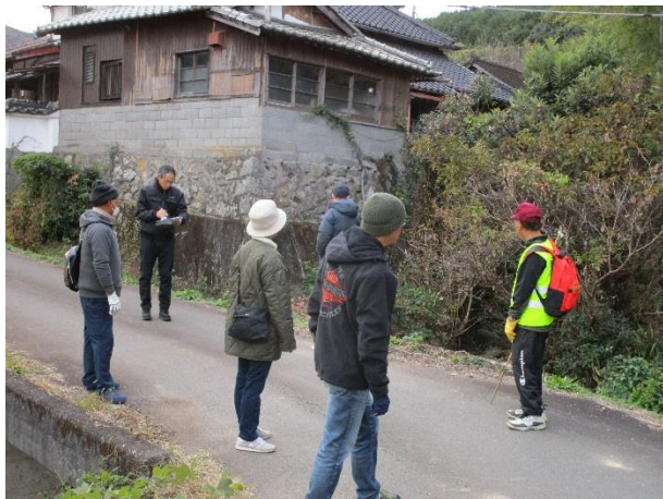
土石流危険箇所を実際に確認(向川内 11/25)

県と市のアドバイスを受けながら4回にわたって行われました。1回目はハザードマップの再点検。2回目はまち歩き。3回目は地区タイムライン（避難行動計画）の作成。4回目は実際の避難訓練。