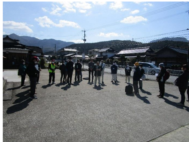
非常持出袋を携えた参加者も(上矢部公民館 3/10)