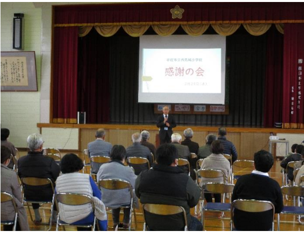
体育館で1年間の地域と学校の交流を振り返りました

日ごろお世話になっている地域の方々を招いて、西馬城小学校が「感謝の会」を開催しました。はじめにこの1年間地域の人たちの支援で体験したことを映像で振り返った後、低学年、高学年の会場に分かれ学習発表会を参観しました。小規模校ならではの一人ひとりが主役の発表でした。