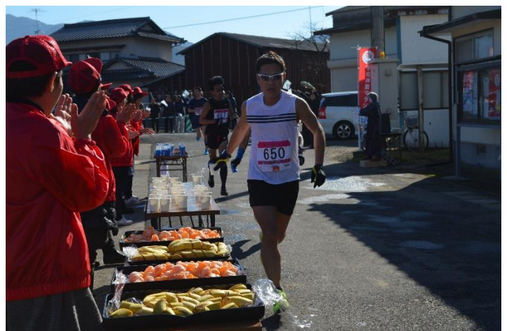
地元ボランティアの声援・もてなし（下矢部公民館前）