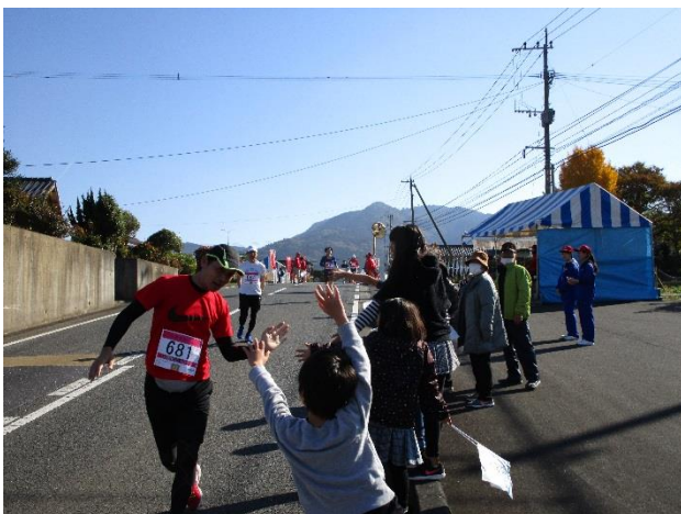
応援の子どもたちとハイタッチ（郵便局前の坂）