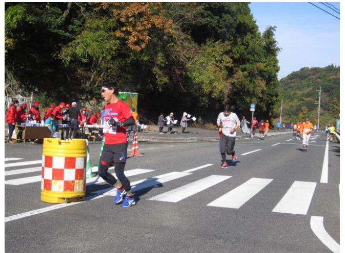
ここは箱根か泣別れ(折り返し地点・談合堂)