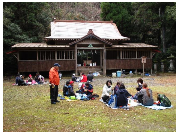
大元神社社殿の前でお弁当(参加者約30名)