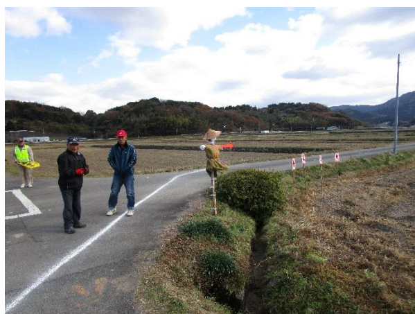
地域の方々が見守りと応援、かかしも道案内