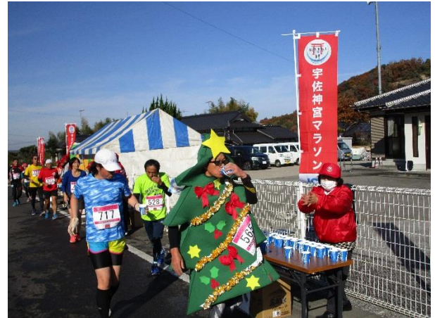
コスプレ(仮装)ランナーも（上矢部公民館前）