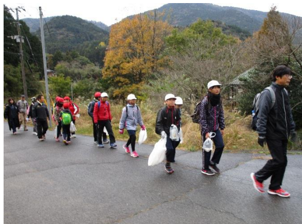
今年もごみ拾いをしながら登りました