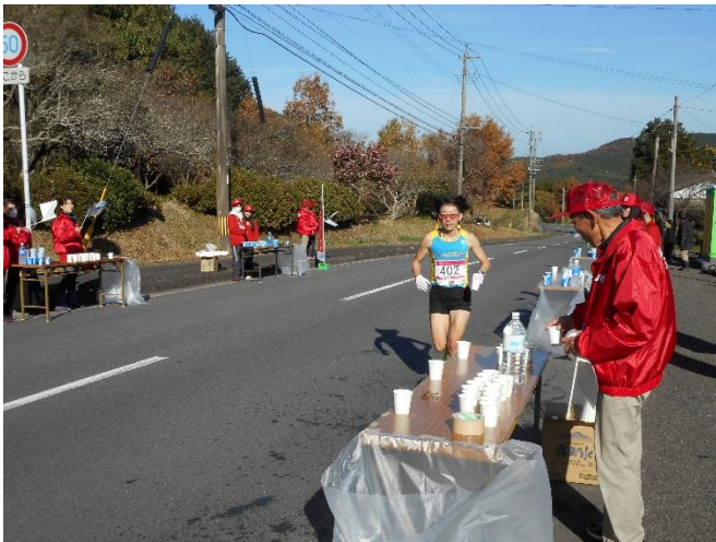
記録をねらうランナーも(食事処「侑」前)