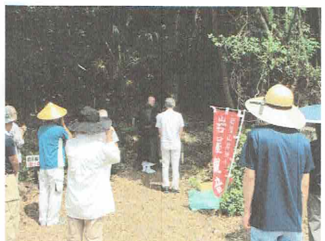
岩屋観音の登り口にて