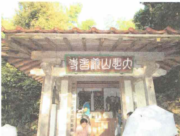
観音寺のお堂にて

8月17日には、上矢部観立地区で観音寺観音講が、また、8月21日には上矢部宮原地区で岩屋観音講が催されました。いずれも、長興寺住職の読経の後、参加者でお茶やお菓子あるいは食事をいただき歓談しました。なお、毎年1月には正覚寺の観音堂で観音講が催されています。