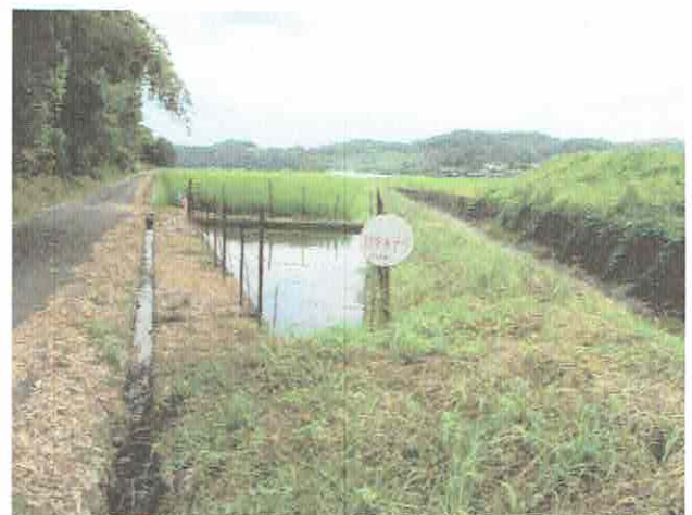
字のかすんだ「防火水そう」の標示（上矢部・向川内）