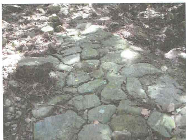
石畳は部分的にきれいに残っています

石畳は峠の七号目辺りまでは確認できますが、それから先は掘切道になっています。さらに進むとメガソーラーの工事現場にぶつかり、道はここで途切れます。大雨の際にこの道が水や土石の流れ道になり、石畳が埋まってしまうかと心配になります。